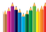
crayons de couleurs