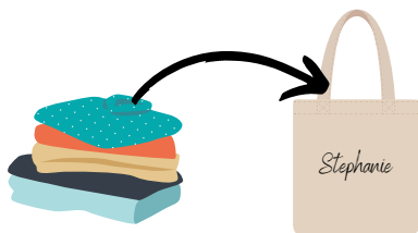
un change complet dans un sac en tissu